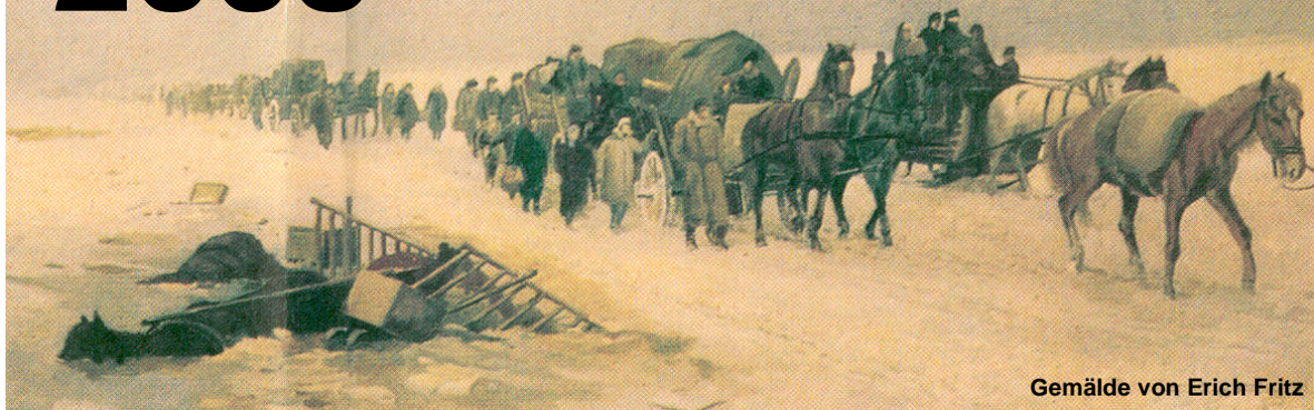
Gemälde von Erich Fritz

Flucht Vertreibung Völkermord abgetrennte Ostgebiete Unrecht