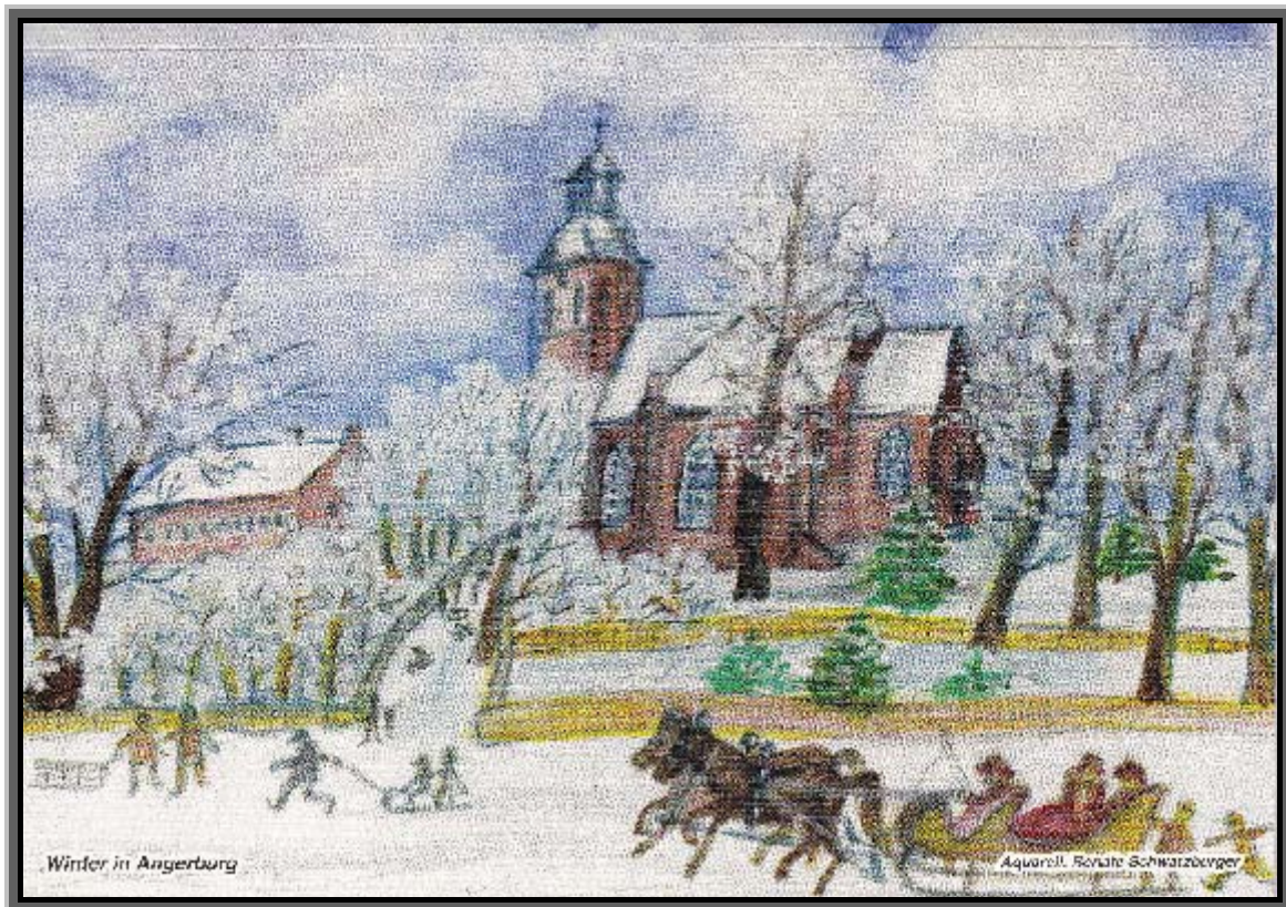
Entnommen „Angerburger Heimatbrief Nr. 146/2010

Es wächst viel Brot in der Winternacht Weil unter dem Schnee frisch grünet die Saat: Erst wenn im Lenze die Sonne lacht, Spürst du, was Gutes der Winter tat. Und deucht die Welt dir öd' und leer Und sind die Tage dir rauh und schwer, Sei still und habe des Wandels acht: Es wächst viel Brot in der Winternacht.